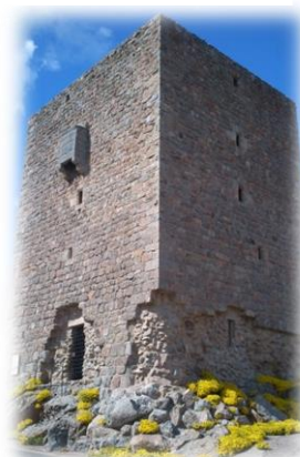
Tour du Cellier

1/50 000 n° 2537- © IGN-Paris 2009-Reproduction interdite-Autorisation n° 32-90.19